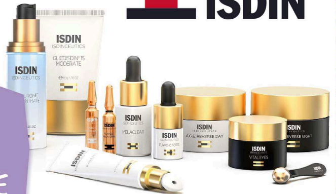
Abb. beispielhaft. Der Rabatt gilt auf den regulären Verkaufspreis in den Bären-Apotheken Holten und Neumühl. Nur gültig auf vorrätige Produkte im Mai 2024.